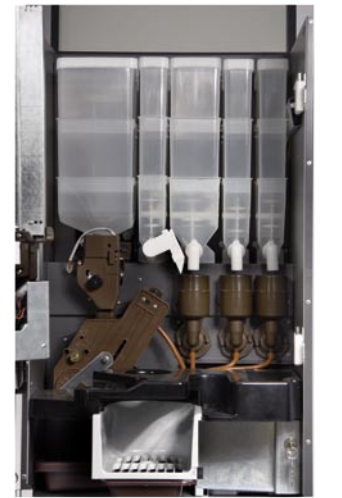
Detalle grupo de erogación y batidores. Wippers and bean-to-cup brewer.