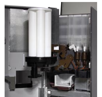
Capacidad para 250 servicios Capacity for 250 drinks