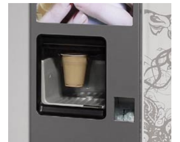
Ventana de recogida de producto Product collection outlet