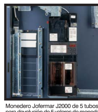
Monedero Jofemar J2000 de 5 tubos para devolución de 5 valores de moneda Change giver Jofemar with 5 refund tubes for 5 different coin values