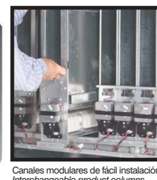
Canales modulares de fácil instalación. Interchangeable product columns.